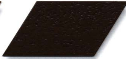
010 nussbaum Cetol WP 560/010 nussbaum Cetol WF 750/010 nussbaum