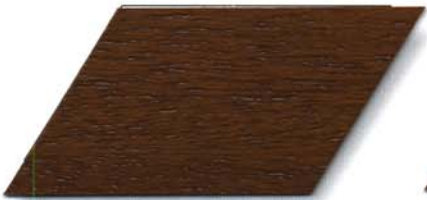
073 altkiefer Cetol WP 560/073 altkiefer Cetol WF 750/073 altkiefer