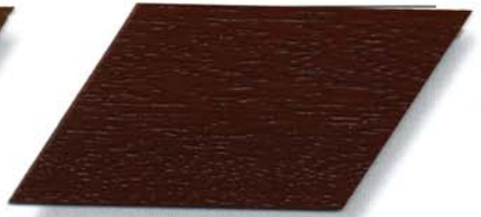
045 mahagoni Cetol WP 560/045 mahagoni Cetol WF 750/045 mahagoni