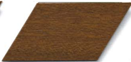
077 kiefer Cetol WP 560/077 kiefer Cetol WF 750/077 kiefer