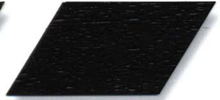
020 ebenholz Cetol WP 560/020 ebenholz Cetol WF 750/020 ebenholz