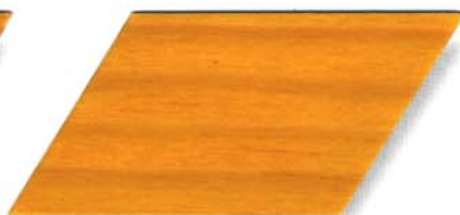
077 kiefer Cetol WV 881/farblos Cetol WP 562/077 kiefer Cetol WF 750/077 kiefer