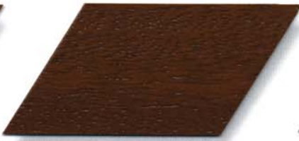
009 eiche dunkel Cetol WP 560/009 eiche dunkel Cetol WF 750/009 eiche dunkel