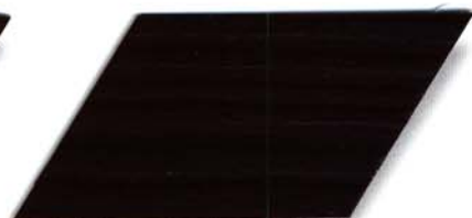
048 palisander Cetol WV 881/farblos Cetol WP 562/048 palisander Cetol WF 750/048 palisander