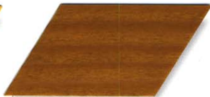
006 eiche hell Cetol WV 881/farblos Cetol WP 562/006 eiche hell Cetol WF 750/006 eiche hell