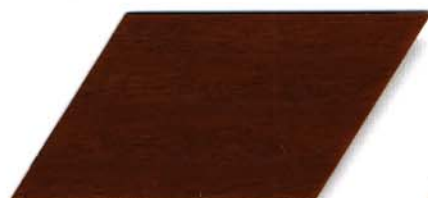
085 teak Cetol WV 881/farblos Cetol WP 562/085 teak Cetol WF 750/085 teak