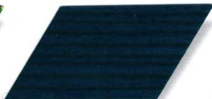
090 sommerblau Cetol WV 881/farblos Cetol WP 562/090 sommerblau Cetol WF 750/090 sommerblau