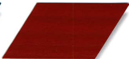
041 signalrot Cetol WV 881/farblos Cetol WP 562/041 signalrot Cetol WF 750/041 signalrot