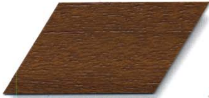
996 esche* Cetol WP 560/996 esche Cetol WF 750/996 esche * kürzeres Renovierungsintervall