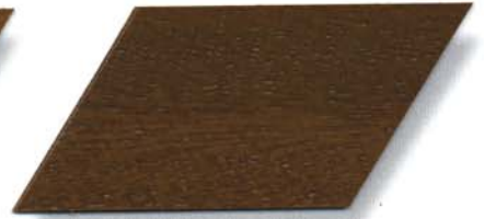
006 eiche hell Cetol WP 560/006 eiche hell Cetol WF 750/006 eiche hell