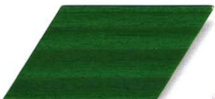
062 russischgrün Cetol WV 881/farblos Cetol WP 562/062 russischgrün Cetol WF 750/062 russischgrün