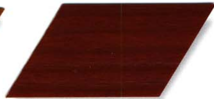
045 mahagoni Cetol WV 881/farblos Cetol WP 562/045 mahagoni Cetol WF 750/045 mahagoni