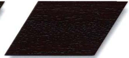
048 palisander Cetol WP 560/048 palisander Cetol WF 750/048 palisander