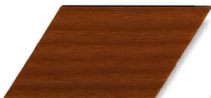
073 altkiefer Cetol WV 881/farblos Cetol WP 562/073 altkiefer Cetol WF 750/073 altkiefer