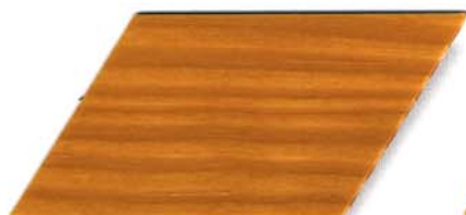
996 esche* Cetol WV 881/farblos Cetol WP 562/996 esche Cetol WF 750/996 esche * kürzeres Renovierungsintervall