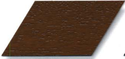
089 afrormosa Cetol WP 560/089 afrormosa Cetol WF 750/089 afrormosa