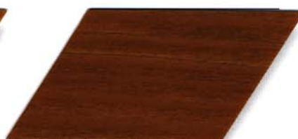
009 eiche dunkel Cetol WV 881/farblos Cetol WP 562/009 eiche dunkel Cetol WF 750/009 eiche dunkel