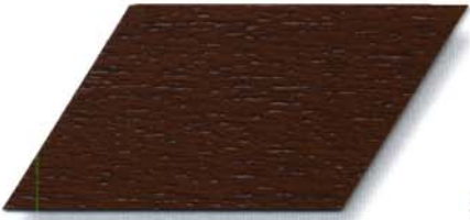
085 teak Cetol WP 560/085 teak Cetol WF 750/085 teak