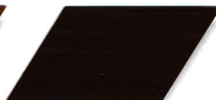
010 nussbaum Cetol WV 881/farblos Cetol WP 562/010 nussbaum Cetol WF 750/010 nussbaum