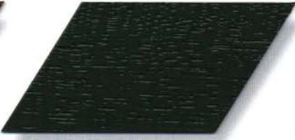
065 olivgrün Cetol WP 560/065 olivgrün Cetol WF 750/065 olivgrün