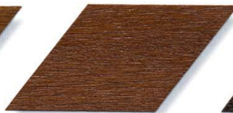
085 teak Cetol WP 560, Cetol WF 755