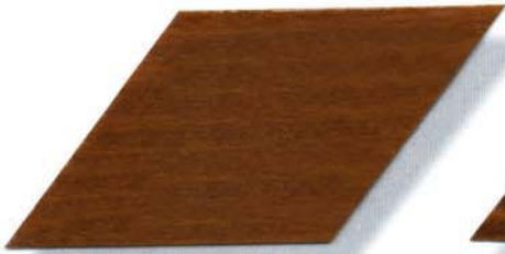
085 teak Cetol WP 560/Cetol WF 755