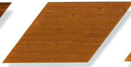
089 afrormosia Cetol WP 560 (075 maisgelb) Cetol WF 755 (089 afrormosia)