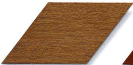
077 kiefer Cetol WP 560, Cetol WF 755