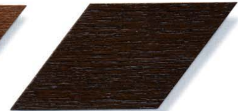
010 nußbaum Cetol WP 560, Cetol WF 755