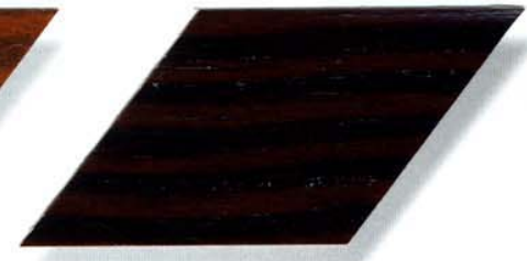
048 palisander Cetol WP 560/Cetol WF 755