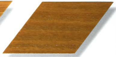
073 altkiefer Cetol WP 560/Cetol WF 755