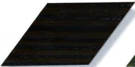
020 ebenholz Cetol WP 560/Cetol WF 755