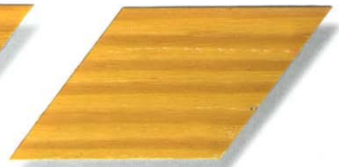
906 microbraun Cetol WP 560 (906 microbraun) Cetol WF 755 (077 kiefer)