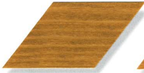
006 eiche hell Cetol WP 560/Cetol WF 755