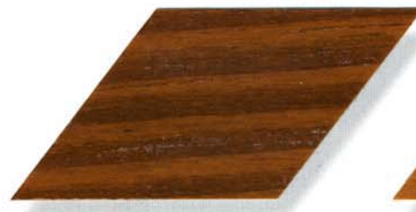
009 eiche dunkel Cetol WP 560/Cetol WF 755