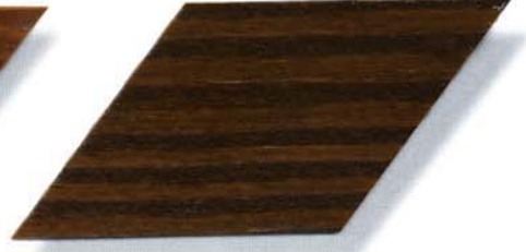
010 nußbaum Cetol WP 560/Cetol WF 755