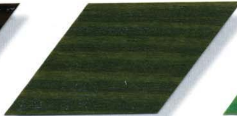
065 olivgrün neu Cetol WP 560/Cetol WF 755