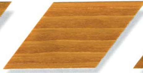
002 kieferbraun Cetol WP 560 (002 kieferbraun) Cetol WF 755 (006 eiche hell)