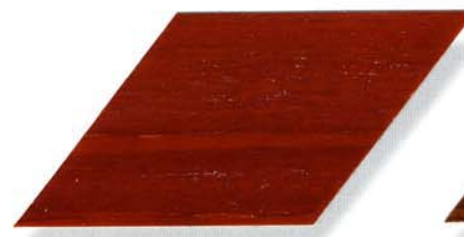
045 mahagoni Cetol WP 560/Cetol WF 755