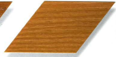
005 hellbraun Cetol WP 560 (005 hellbraun) Cetol WF 755 (089 afrormosia)