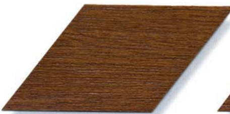
006 eiche hell Cetol WP 560, Cetol WF 755