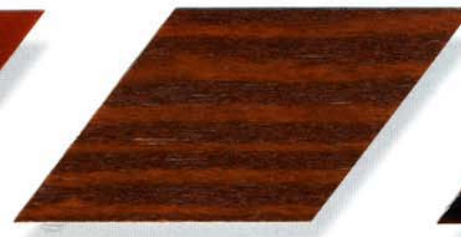
007 braun Cetol WP 560 (007 braun) Cetol WF 755 (045 mahagoni)