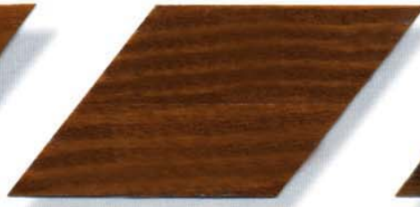
004 rotbraun Cetol WP 560 (004 rotbraun) Cetol WF 755 (085 teak)