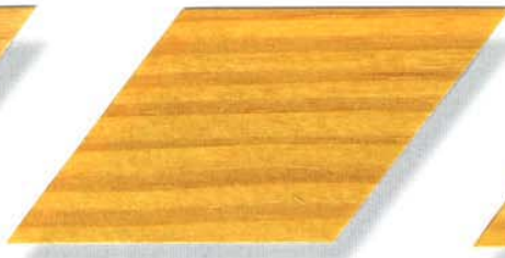
077 kiefer Cetol WP 560/Cetol WF 755