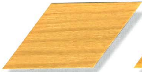
996 esche Cetol WP 560/Cetol WF 755