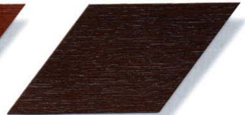
048 palisander Cetol WP 560, Cetol WF 755