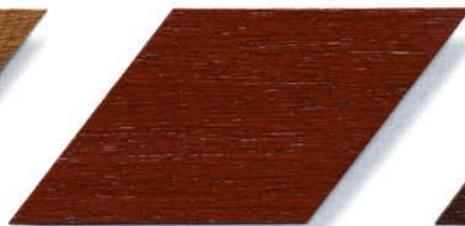
045 mahagoni Cetol WP 560, Cetol WF 755